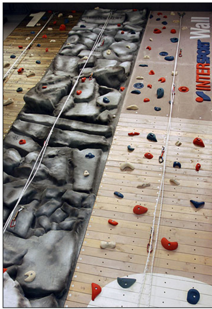
Ściana wspinaczkowa w salonie Intersport

Trawiaste pagóry pól golfowych, skaliste załomy dróg wspinaczkowych, faktura smaganego halnym drewna to niektóre inspiracje mebli i wydzielonych stref sklepu, poświęconych dyscyplinom sportowym i turystyce. Design jest tutaj używany jako metoda wspierania sprzedaży przez wywoływanie pozytywnych emocji u klientów. Przykuć uwagę a następnie wciągnąć klienta w emocjonującą grę zakupów to cel projektantów ze studia KONTEKST i jednocześnie klucz do sukcesu marki.