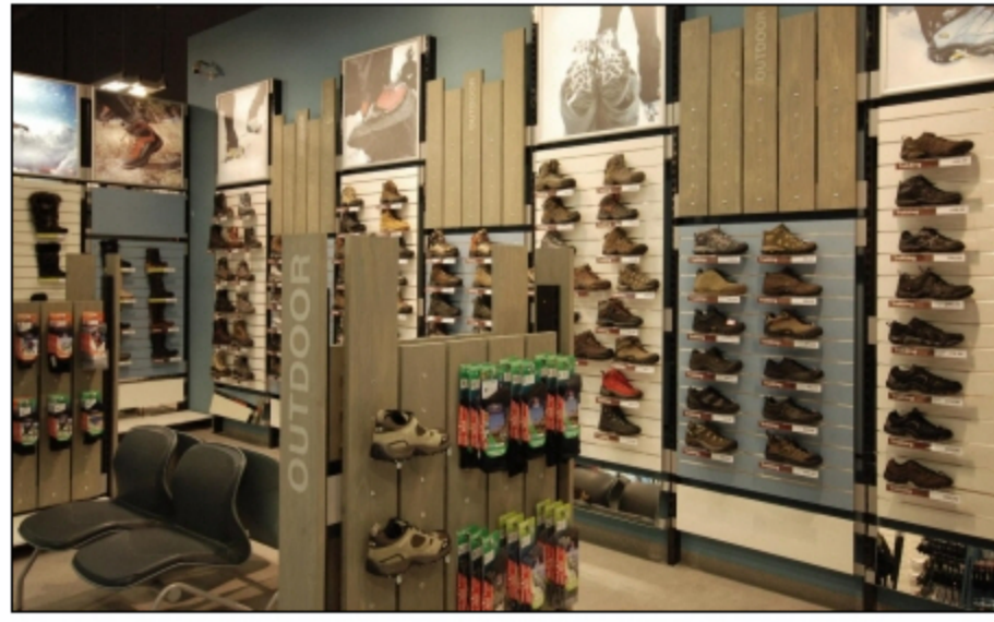
Stoisko outdoorowe w sklepie Intersport

Koncept jednostki wzorcowej dla sieci sklepów INTERSPORT powstał w studiu projektowym KONTEKST specjalizującym się w branży Retail Design.